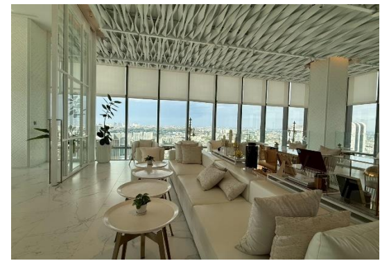
ภาพที่ 1.2-2 สภาพโครงการปัจจุบัน